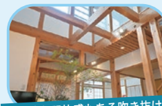
耐震性も開放感もある吹き抜け