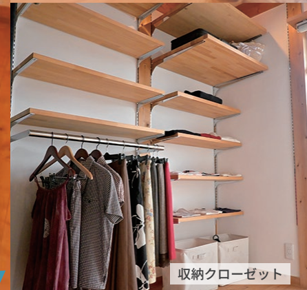
収納クローゼット