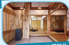
廊下を省いた間取り