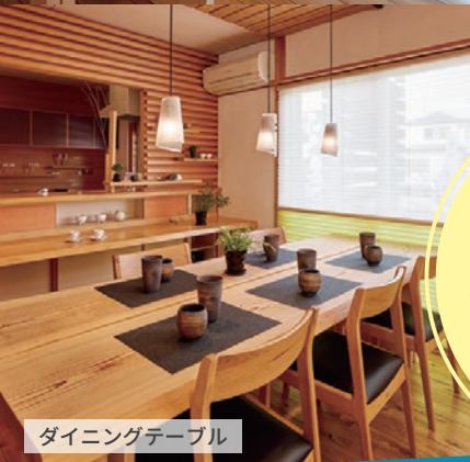
ダイニングテーブル