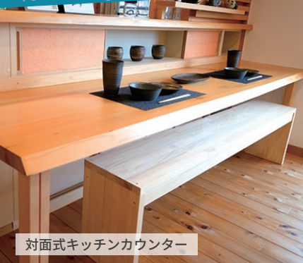
対面式キッチンカウンター