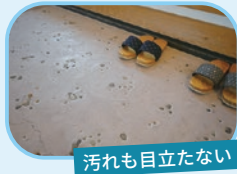
汚れも目立たない

伝統的な日本家屋に土間が設けられていたのは、収納場所や作業場所、かまどのある台所など、便利に活用できる理由がありました。現代でも、廊下を無くして土間を設け有効活用が可能です。収納スペースやコミュニケーション空間、趣味スペースなどです。玄関と部屋の風通し用として使用しながら、玄関一枚隔てるとそこは、もう一つの庭にの続き間のような役割です。自転車やバイク、ベビーカーなども、外出から帰ってそのまま土間に入れても問題ありません。盗難防止になるうえ、雨風を避けて保管することができます。週末のDIYスペースや、子どもが外で遊ぶおもちゃなどを置いておく場所としても便利です。