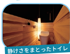
静けさをまとったトイレ

モデルハウス内に自然の緑と和の自然素材を調和させた空間が多数存在しています。トイレはその性質上、利用頻度が多く、必要不可欠な場所。その空間がなぜかほっとして癒やされる場所であれば嬉しいですね。また、近年人気になりつつある和室スペースは家の中で整う時間を作る究極のデトックススペースともいえます。