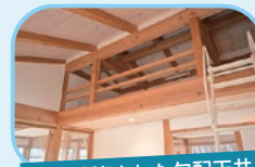
構造計算された勾配天井

木造建築でも地震に強い家を提供するため、すべての建物に構造計算を行っています。鉄筋コンクリートや鉄骨建築と同等の耐震性能を確保しています。建築基準法の「4号特例」による免除を受けることなく、西城建設はすべての建物で構造計算を実施し、地震や台風、積雪などの自然災害に耐える安全で信頼性の高い住環境を提供しています。無垢の木の美しさと耐震性能を両立し、高品質な住まいづくりを行っています。