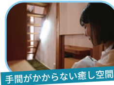
手間がかからない癒し空間

居室内に庭?と思うかもしれませんが、独自のシステムでデッドスペースになりやすい場所、例えば階段下などにさりげない【箱庭】を作ることが可能です。