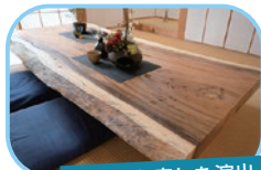
家具でも癒しを演出